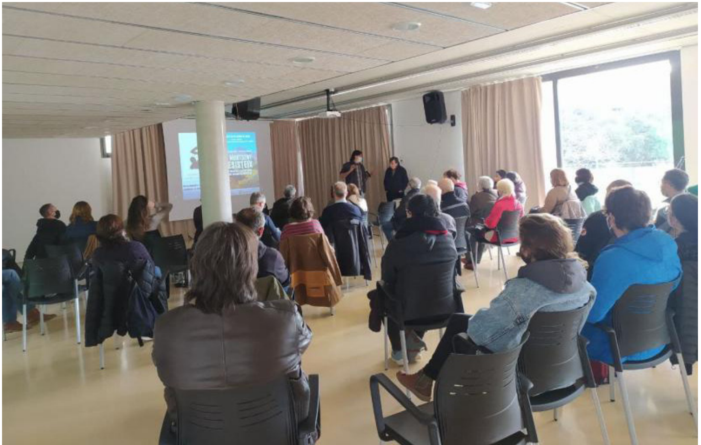
Trobada «El Montseny resisteix» del mes de febrer passat a Montseny.

Consell de Redacció Sant Celoni, maig del 2022